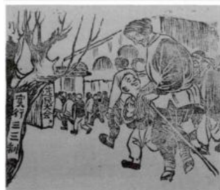
《三三制选举》，《解放日报》 1942 年 9 月 28 日第 3 版