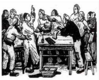
古元：《减租会（一九四三）》 东北画报社 1949 年版