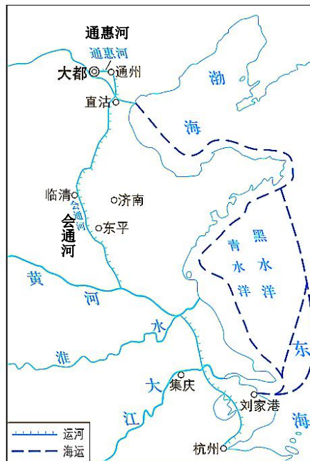
图 2 元代大运河

(隋代大运河是在春秋至三国近 1200 年间历代修筑的地区性运河的基础上，由隋炀帝指派工程专家宇文恺总负责，勾连贯通，清淤筑坝，历时五年修筑而成。2014 年，包括隋朝大运河在内的我国古代十段河道被列入世界文化遗产。)