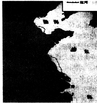
图2 元代大运河示意图

(隋代大运河是在春秋至三国近1200年间历代修筑的地区性运河的基础上,由隋炀帝指派工程专家宇文恺总负责,勾连贯通,清淤筑坝,历时五年修筑而成。2014年,包括隋朝大运河在内的我国古代十段河道被列入世界文化遗产。)